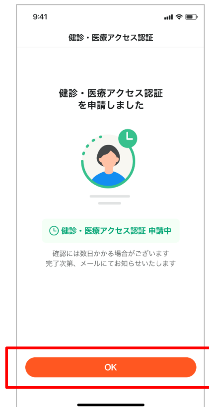
【申請画面が表示された場合】

確認が必要な場合は、上記が表示される場合があります。完了メールをお待ちくださいませ。